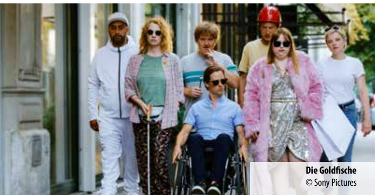
Die Goldfische