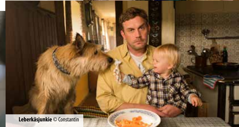
Leberkäsjunkie © Constantin