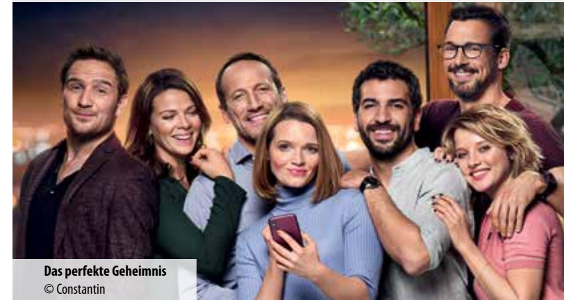
Das perfekte Geheimnis