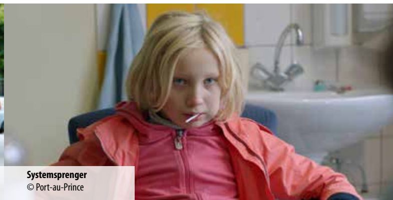
Systemsprenger © Port-au-Prince