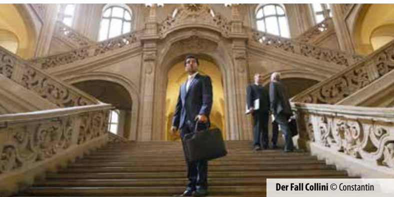
Der Fall Collini © Constantin