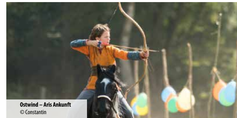
Ostwind – Aris Ankunft