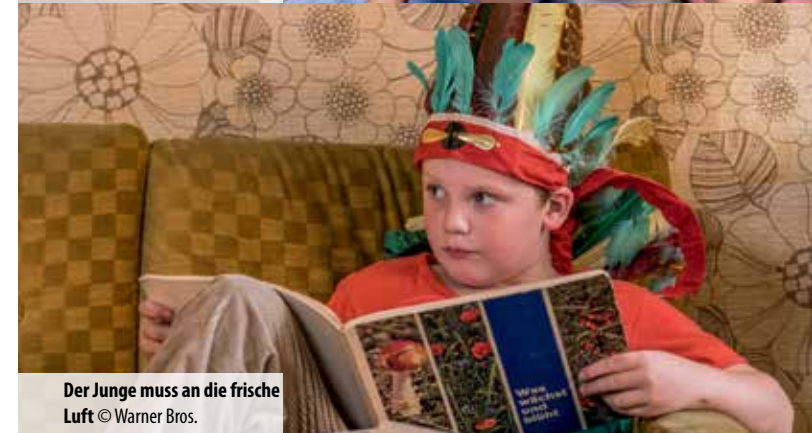
Der Junge muss an die frische Luft